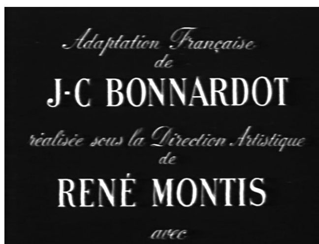
2. Générique déroulant de fin de la version française d' Othello (1952). Cette image marque le début du déroulant et précède l'illustration 1