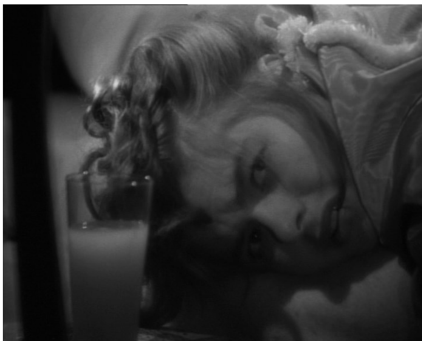
Figure 143 : Ingrid Bergman dans le rôle d'Alicia. Son univers semble vaciller : son nouvel amant est en réalité un ennemi et il l'a assommée. Une fois de plus, elle a trop bu et la pièce tourne autour d'elle.

Le lendemain matin, Alicia se réveille avec la gueule de bois et la tête qui tourne.