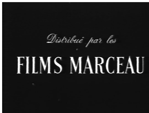
7. Dernière image (fixe) du générique de fin. Elle apparaît à la suite du déroulant par un fondu enchaîné et s'achève par un fondu au noir