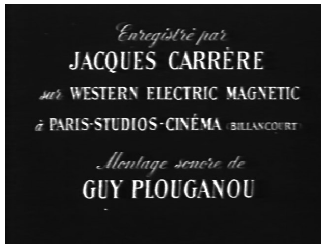
6. Suite de l'illustration 5 et fin du déroulant