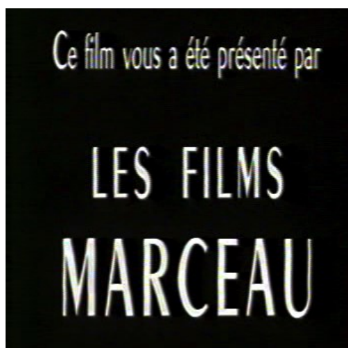
3. Première image (fixe) du générique de fin de la version française d'Othello (1952). Cette image suit un carton « FIN », en français sur fond noir, placé après la dernière image du film